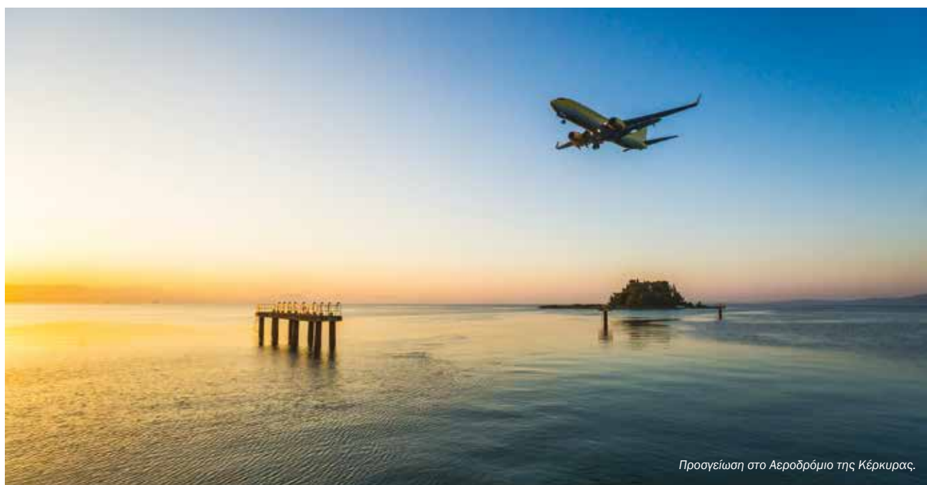
Προσγείωση στο Αεροδρόμιο της Κέρκυρας.

Όλες οι Εγκαταστάσεις Επεξεργασίας Λυμάτων έχουν υποστεί βαριές εργασίες συντήρησης, ενώ ο λεπτομερής σχεδιασμός δίνει τη δυνατότητα είτε για τη σύνδεση με το Δημοτικό Δίκτυο Αποχέτευσης είτε για την κατασκευή νέων εγκαταστάσεων υψηλών προδιαγραφών.