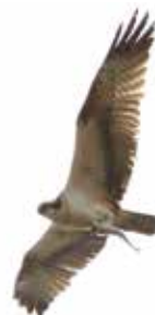
Ψαραετός ( Pandion haliaetus ) στο αεροδρόμιο της Καβάλας (ΚΒΑ).

Ενδιαφέροντα στιγμιότυπα από τις εν εξελίξει έρευνες αναφορικά με τα είδη Άγριας Ζωής που εντοπίζονται στα αεροδρόμια: