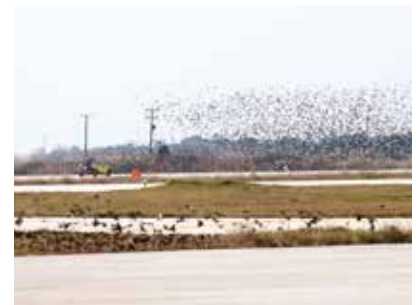
Ψαρώνια ( Sturnus vulgaris ) πάνω από το διάδρομο προσγειώσεων-απογειώσεων στην Καβάλα (ΚΒΑ).