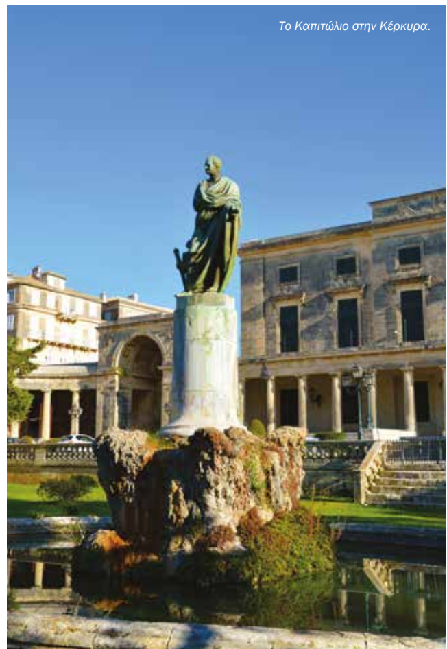
Το Καπιτώλιο στην Κέρκυρα.