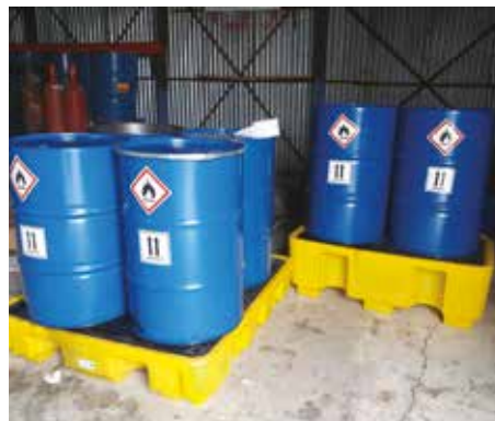
Βαρέλια για την αποθήκευση χρησιμοποιημένων ελαίων σε εσωτερικό χώρο. Τα χρησιμοποιημένα έλαια αποστέλλονται προς ανακύκλωση δια μέσω του αντίστοιχου Συστήματος Εναλλακτικής Διαχείρισης.

Ενημερωτικά αυτοκόλλητα τοποθετήθηκαν σε κάθε δοχείο προς ενημέρωση του προσωπικού για το περιεχόμενο και την επικινδυνότητά του.